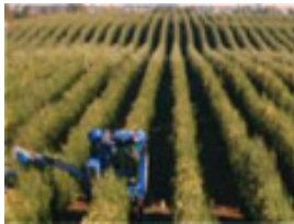
Superintensivo (>1500 árboles/ha)