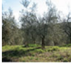
Vaso (1 tronco)