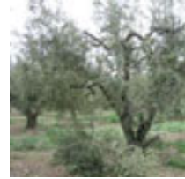
Vaso (2-3 troncos desde el suelo)